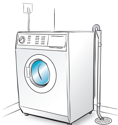
TVÄTTMASKIN - FAST INSTALLATION

Spara bruksanvisningar, garantisedlar och kvitton. Förvara dem i din Bopärm så att du hittar dem när de behövs.